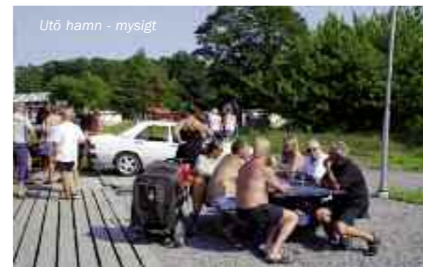
Utö hamn - mysigt