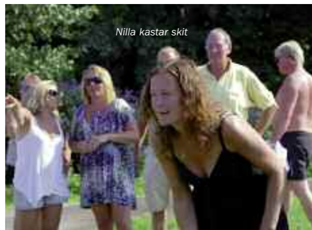
Nilla kastar skit