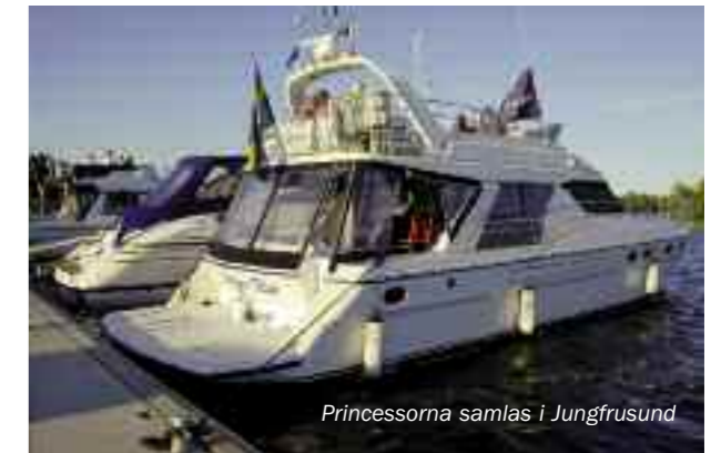
Princessorna samlas i Jungfrusund