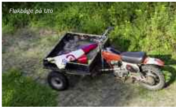
Flakbåge på Utö

Utö är en speciell ö, där finns ett antal bilar, motorcyklar, mopeder, cyklar och flakmoppar - men även ett par smått unika flakbågar! Jag lyckades faktiskt få syn på en av dessa tämligen skygga varelser som inte finns i någon större utsträckning på fastlandet vad jag vet. De utgör helt enkelt en del av den unika faunan på Utö.