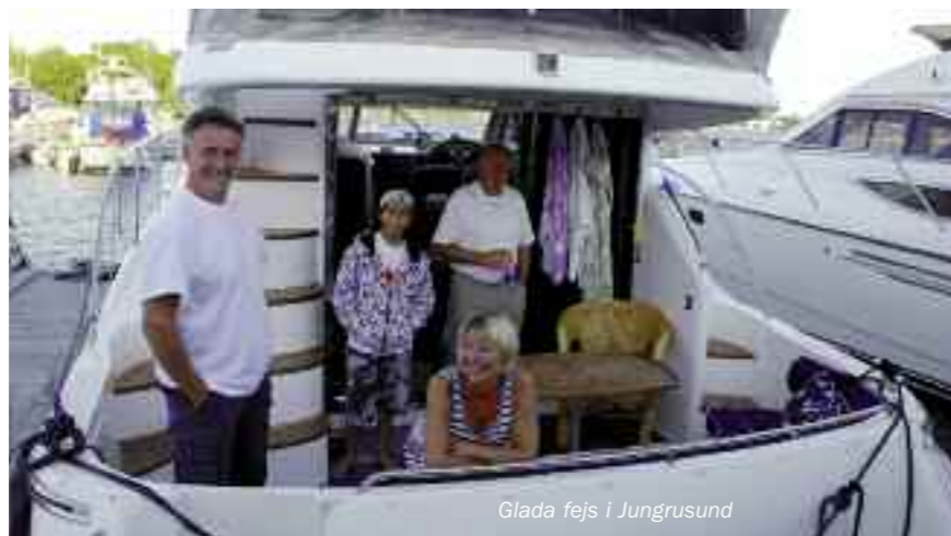
Glada fejs i Jungfrusund