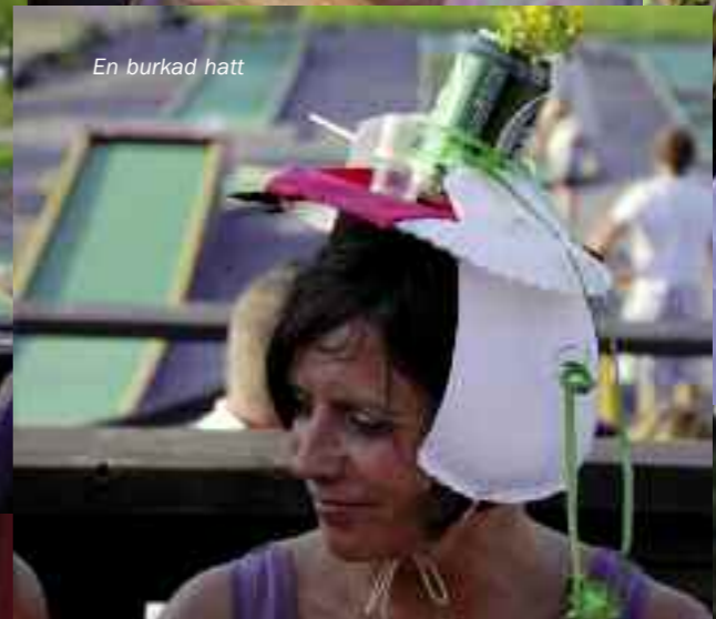
En burkad hatt