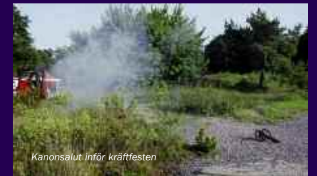
Kanonsalut inför kräftfesten