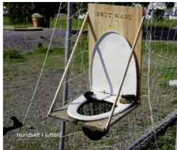
Hundskit i luften!