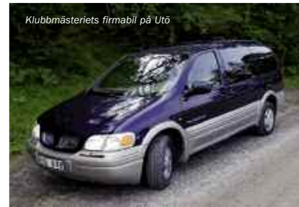
Klubbmästeriets firmabil på Utö

Lördagseftermiddagen inleddes med Styrelsemöte som fick vara klart till två-tiden för då kördes som traditionen anger drickavagnen fram av Klubbmästarna. De sista båtarna ankom också precis i tid för aktiviteterna.