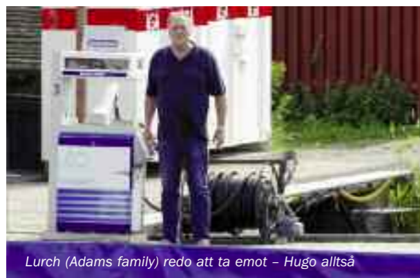
Lurch (Adams family) redo att ta emot – Hugo alltså