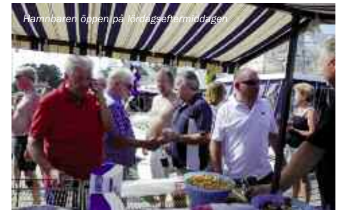
Hamnaren öppen på lördagseftermiddagen