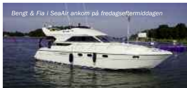
Bengt & Fia i SeaAir ankom på fredageftermiddagen

Som vanligt hade vår egen klubbmästare Roffe fullt upp med