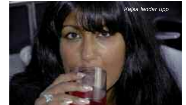
Kajsa laddar upp

Några av oss som var där redan på torsdagen hann förbereda oss rejält samt kolla upp öns festkapacitet i god tid innan kräftskivan. Många anslöt sedan på fredagen och på kvällen grillades det både här och där runt om i hamnen.