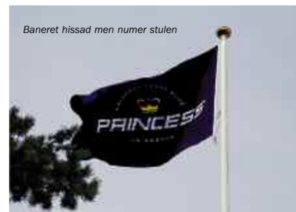
Baneret hissad men numer stulen

Några av oss som var där redan på torsdagen hann förbereda oss rejält samt kolla upp öns festkapacitet i god tid innan kräftskivan. Många anslöt sedan på fredagen och på kvällen grillades det både här och där runt om i hamnen.