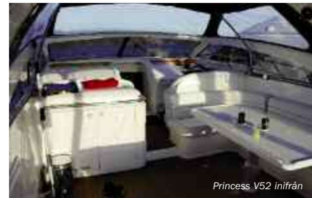
Princess V52 inifrån

Fem Princessor guppade stillsamt i hamnen och erbjöd en skön fond under dagarna likaväl som på kvällarna då vi satt på flybridge och avnjöt konserterna likaväl som de ganska omfattande repetitionerna. Jungfrusund Restaurang hade dukat upp med en bra grillbuffé så oss gick det ingen direkt nöd på.