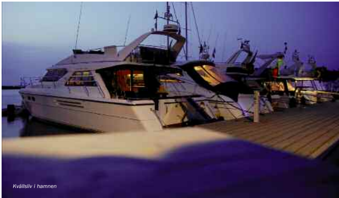
Kvällsliv i hamnen