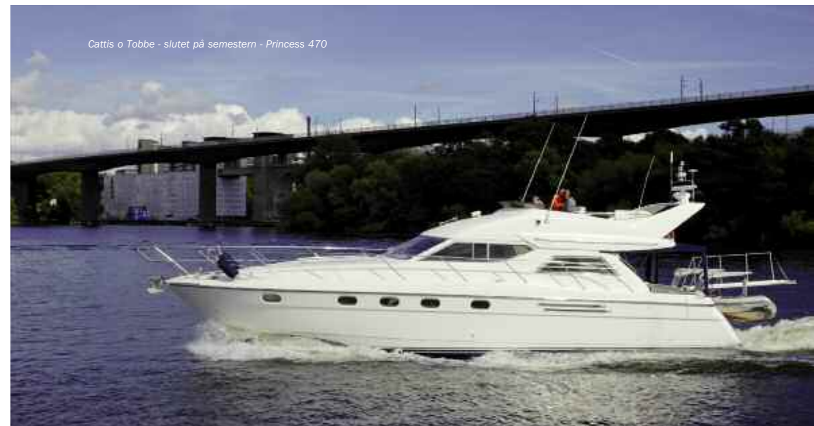
Cattis o Tobbe - slutet på semestern - Princess 470