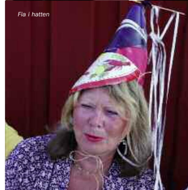
Fia i hatten