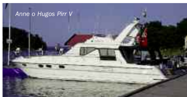
Anne o Hugos Pirr V