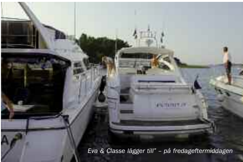
Eva & Classe lägger till" – på fredageftermiddagen