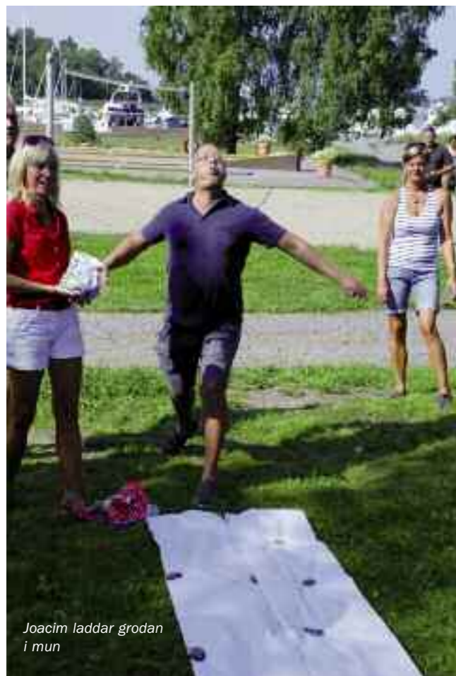
Joacim laddar grodan i mun