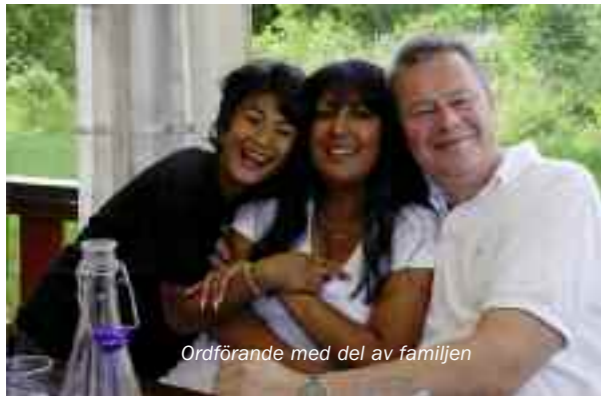
Ordförande med del av familjen

På fredagen hann vi med en skön räksallad till lunch på Seglarbaren mellan springet på bryggan för att ta emot alla ankommande.