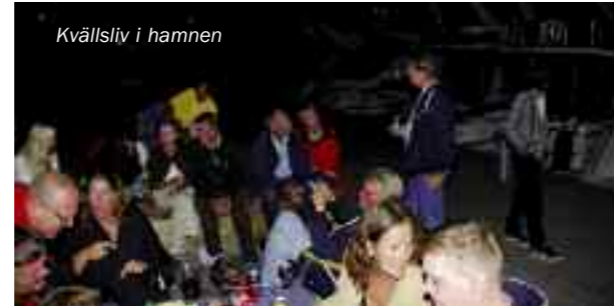
Kvällsliv i hamnen

Fredagseftermiddagen gick över i grillaktiviteter i hamnen medan några åt middag på Seglarbaren. Efter middagen blev det en totalt oorganiserad samling kring bryggorna men med fantastisk stämning som bara inte ville lägga sig.