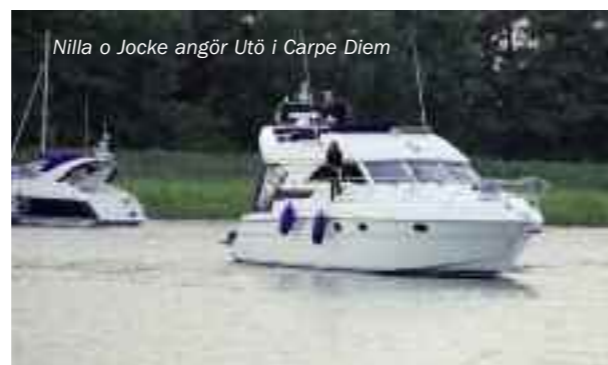
Nilla o Jocke angör Utö i Carpe Diem