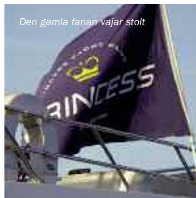
Den gamla fanan vajar stolt

Lördagen bjöd på Charlotte Perrelli, Eric Gadd, Magnus Carlsson med flera under temat "Månsten i Augusti", en betydligt softare tillställning! Helgen hade helt klart något för alla smaker.