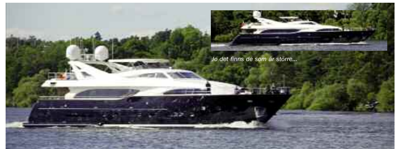
Jo det finns de som är större...